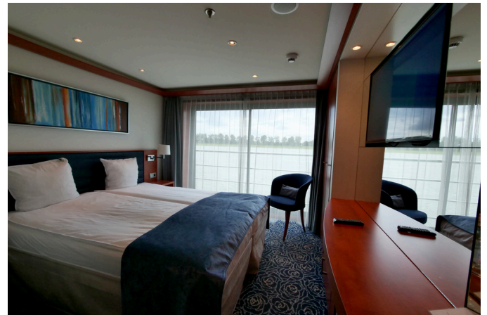
Beispiel: Kabine auf dem Countess Deck

Die MS Verdi ist ein luxuriöses Flusskreuzfahrtschiff, das den Gästen mit seiner Innenausstattung eine gemütlich-wohnliche Atmosphäre auf Ihrer Reise bietet. Die insgesamt 69 Kabinen verteilen sich auf 3 Decks. Auf dem Duchess Deck befinden sich 13 Kabinen, auf dem Countess Deck sowie auf dem Empress Deck befinden sich jeweils 24 Kabinen. Außerdem gibt es sowohl auf dem Empress Deck als auch auf dem Countess Deck jeweils 4 geräumige Suiten. Alle Kabinen auf dem Countess und Empress Deck verfügen über einen französischen Balkon. Die Kabinen auf dem Duchess Deck haben großzügige Panoramafenster (nicht zu öffnen). Die Kabinen haben ein eigenes Badezimmer mit Dusche/WC und sind mit TV, Safe, Haartrockner, individuelle Klimaanlage und einem Mini-Kühlschrank ausgestattet. Die Doppelbetten sind fest installiert und können daher nicht getrennt werden. Außerdem verfügt das Schiff über einen Aufzug zwischen dem Countess-Deck, den Zwischenebenen (Rezeption, Lounges, restaurant) und Empress-Deck.