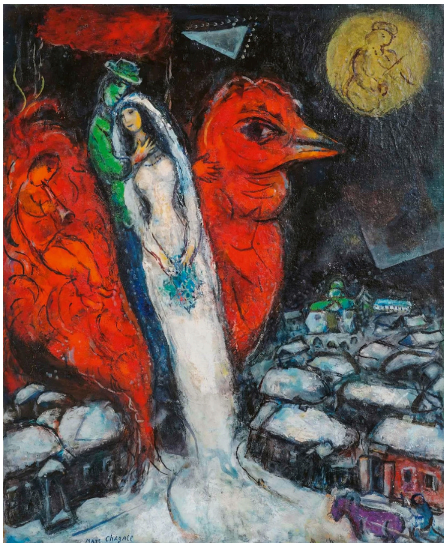
Marc Chagall, Liebespaar mit rotem Hahn, 1956-1965, Les amoureux au coq rouge, Öl, Gouache, Tempera und Tinte auf Leinwand, 81 x 66 cm, Privatsammlung Deutschland